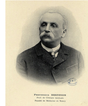
H. Bernheim (1840-1919)